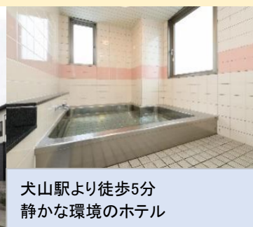
犬山駅より徒歩5分 静かな環境のホテル

食事条件 1泊朝食 朝:和食 夕:なし 部屋タイプ 洋室・和室 チェックイン 16:00/ チェックアウト 10:00 大浴場 あり ランドリー あり 駐車場 あり(無料)