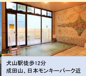
犬山駅徒歩12分 成田山、日本モンキーパーク近

食事条件 1泊朝食 朝:和食 夕:なし 部屋タイプ 洋室・和室 チェックイン 15:00/ チェックアウト 10:00 大浴場 あり ランドリー なし(近隣にコインランドリーあり) 駐車場 あり(無料)