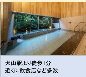
犬山駅より徒歩1分 近くに飲食店など多数

食事条件 1泊朝食 朝:お弁当 夕:なし 部屋タイプ 洋室 チェックイン 15:00/ チェックアウト 10:00 大浴場 あり ランドリー あり 駐車場 あり(有料600円/泊)