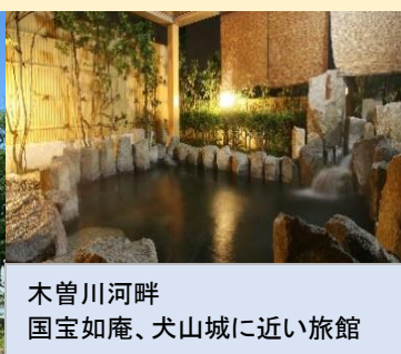
木曾川河畔 国宝如庵、犬山城に近い旅館

食事条件 1泊朝食 朝:和食 夕:なし 部屋タイプ 和室 チェックイン 15:00/ チェックアウト 10:00 大浴場 あり ランドリー なし(近隣にコインランドリーあり) 駐車場 あり(無料)